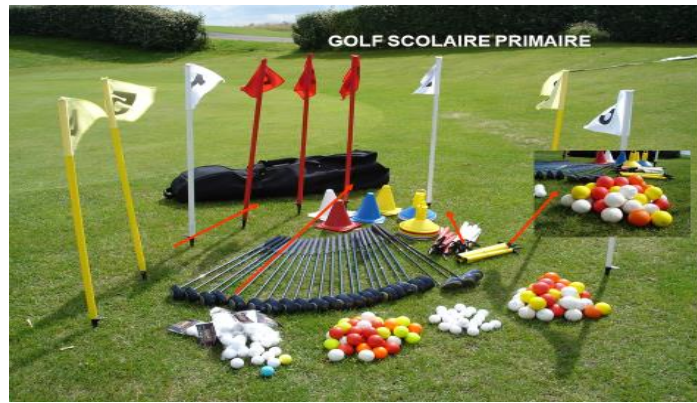
Le "kit golf" pédagogique