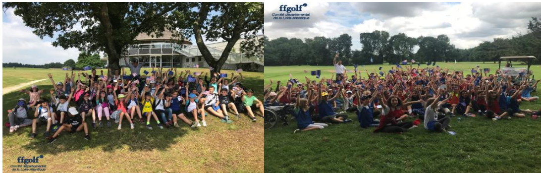
Ovations finales après une journée bien remplie